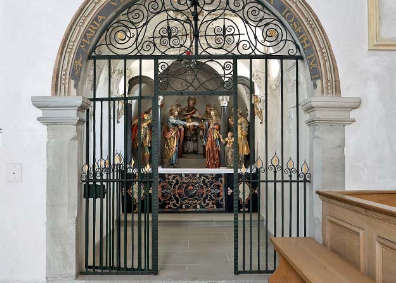
Südliche Seitenkapelle: der Vermählung von Maria und Josef gewidmete Figurenszene