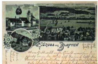
Pilgerpostkarte von 1900: Blatten war beliebter Wallfahrtsort.