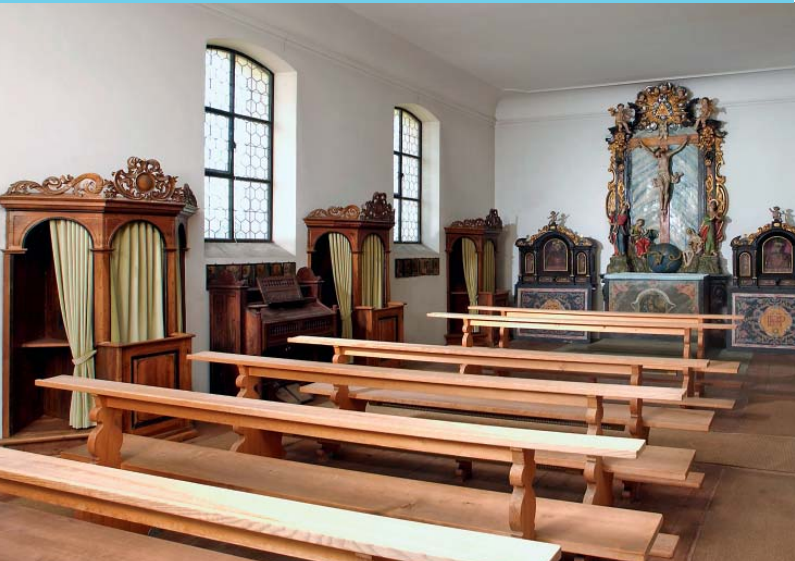
Das Beichthaus mit acht Beichtstühlen und dem Rokoko-Kreuzaltar