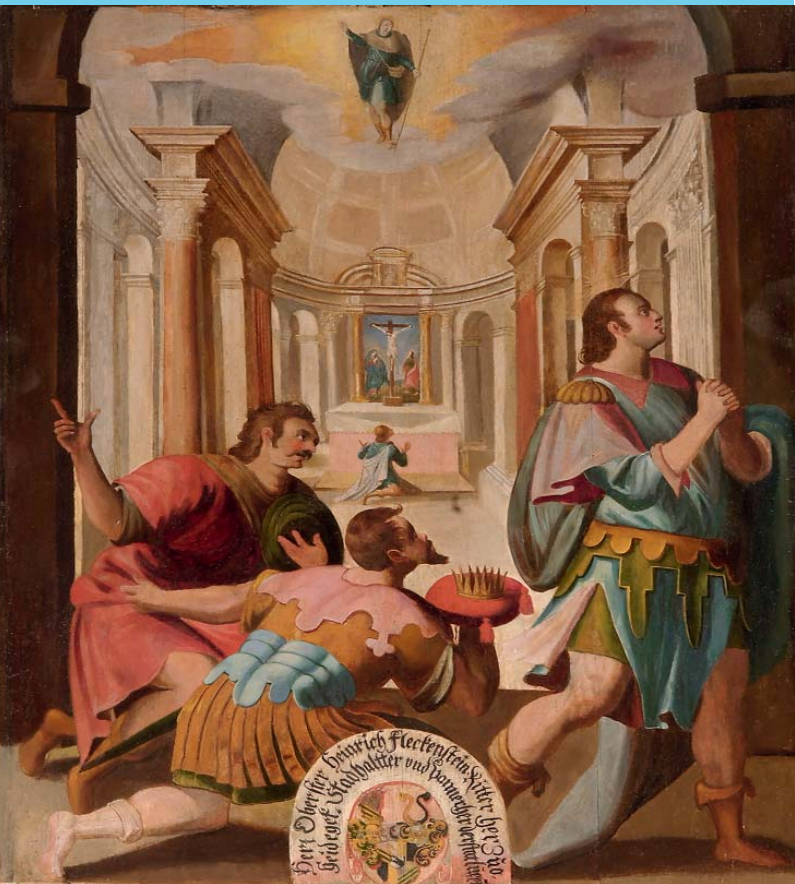
Bild Nr. 4 des neuen Bilderzyklus, gestiftet von Herr Oberster Heinrich Fleckenstein, Ritter von zuo Heideget, Stadthalter und Pannerherr der Stadt Lucern: Der hl. Jost erbittet sich 8 Tage Bedenkzeit, um in einem Kloster im Gebet den richtigen Entschluss zu finden, ob er die von Gesandten seines Bruders angebotene Königskrone annehmen oder der verspürten göttlichen Berufung folgen solle.