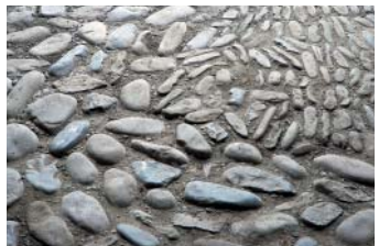
Natursteinboden in der Remise

Die Beichtkapelle wird zu einem multifunktional nutzbaren Raum umgestaltet. Er soll für Veranstaltungen spiritueller und kultureller Art genutzt werden können. Unter Belassung wesentlicher Ausstattungsteile soll die ursprüngliche Funktion sichtbar bleiben. Die Remise wird ohne Veränderung der Raumambiance für einfache Bewirtungen eingerichtet.