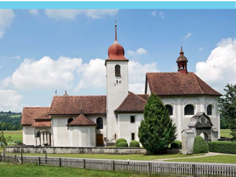
Südansicht der Kirche: Das während 200 Jahren entstandene Ensemble von Baukörpern wirkt als formschöne Einheit.