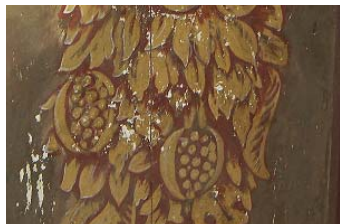
Schadhafte Stelle am Hochaltar

Der Hochaltar weist besonders hohen Renovationsbedarf auf. Das Traggerüst ist konstruktiv aus den Fugen geraten, weshalb die Stabilität des rechtsseitig wegrückenden Aufbaus absehbar in Frage gestellt wäre. Dazu kommen der an mehreren Stellen festgestellte Wurmbefall, der desolate Zustand der Fassungen und Ablätterungen der Vergoldungen, missglückte Übermalungen aus der letzten Renovation sowie herausgefallene Schmuckteile. Deshalb muss der Hochaltar völlig demontiert, Stück für Stück restauriert und neu aufgebaut werden.